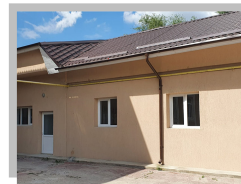
CANTINA DE ASISTENTA SOCIALA